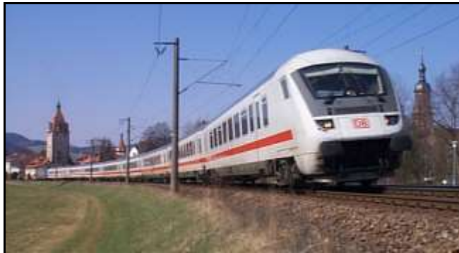
Klobige Maste aus Schleuderbeton an der Schwarzwaldbahn im unteren Kinzigtal, hier bei Gengenbach.

Die drei mit der Elektrifizierung des ersten Abschnitts beauftragten Unternehmen, Siemens (Offenburg - Hausach), BBC (Hausach - Sommerau) und AEG (Sommerau - Villingen), überspannten 205 km Gleis mit Fahrleitungen. In den Abschnitten von Offenburg bis Hornberg, sowie zwischen Sommerau und Villingen wurde die Bauart RE 160 (Regelfahrleitung für bis zu 160 km/h) eingesetzt. Auf der Rampenstrecke reichte die einfachere RE 100, deren "härtere" Stützpunkte bei den gefahrenen 70 km/h keine Nachteile bringen. Deutlich sichtbares Unterscheidungsmerkmal sind die Y-Beiseile an den Stützpunkten. Die Hänger, an denen der Fahrdraht aufgehängt wird, sind dabei nicht unmittelbar am Tragseil befestigt, sondern an besagtem Beiseil.