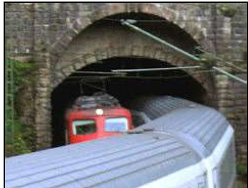
Eng geht es zu im 835 m langen Großen Triberger Kehrtunnel

Die Darstellung des Aufwands, der bei der Elektrifizierung der Schwarzwaldbahn getrieben werden musste, könnte dagegen ein ganzes Buch spielend füllen. Allein auf der 86 km langen Strecke zwischen Offenburg und Villingen, dem ersten Bauabschnitt, hatten 36 der 37 Tunnel mit einer Gesamtlänge von 9.549 m ein unzureichendes Profil, um die Fahrleitung aufnehmen zu können. Eine Profilaufweitung musste in der Höhe um 50 bis 60 cm, aber in einzelnen Fällen auch in der Breite um einige cm erfolgen. Bei 35 Tunnel wurde die fehlende Höhe durch Absenkung der Tunnelsohle erreicht, nur im Kleinen Triberger-Tunnel musste das Gewölbe aufgeweitet werden.